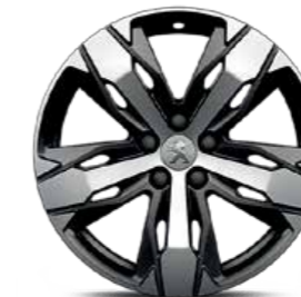
18" ALLOYS, "LOS ANGELES", diamond cut, Continental CCLX2 عجلات ألومنيوم "لوس أنجلوس" قياس 18 بوصة، قصة ألماسية، كونتيننتال CCLX2

Your new PEUGEOT 3008 PHEV comes with 18" alloy wheels for more elegance and character.