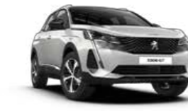
White Pearl أبيض لؤلؤي