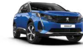
Blue Vertigo أزرق فرتيجو