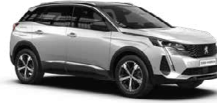
The 3008 HYBRID4 The new 3008 comes with an Electric Engine & Internal Combustion Engine. Just enough for short urban rides or longer drives.

بيجو 3008 هايبرد 4 تأتي بيجو 3008 الجديدة بمحرك كهربائي ومحرك ذات الاحتراق الداخلي لتناسب الرحلات القصيرة في المدينة، أو الرحلات الطويلة خارجها.