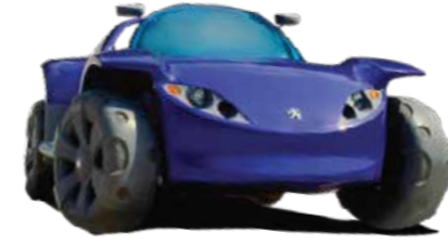
The PEUGEOT TOUAREG PEUGEOT's first-ever hybrid 4x4, with a single-cylinder engine, which acted as a generator.

بيجو تواريج أول مركبة هجينة ورباعية الدفع لبيجو، مع محرك أحادي الأسطوانات يعمل كمولد كهربائي.