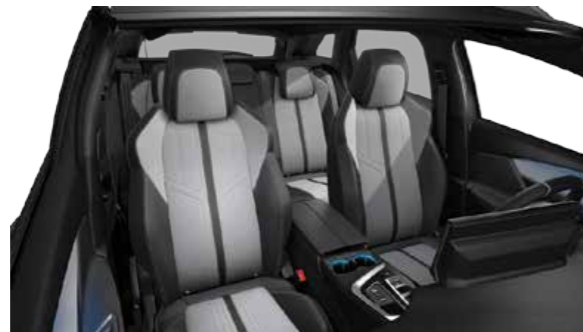
Grey Alcantara Interiors قماش ألكانترا الرمادي