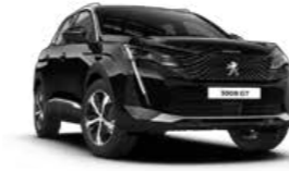
Black Perla Nera أسود لؤلؤي نيرا