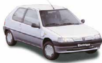
The PEUGEOT 106 ELECTRIC The first electric passenger car for private individuals.

بيجو 106 إلكتروك أول سيارة كهربائية للركاب، مخصصة للاستعمال الفردي الخاص.