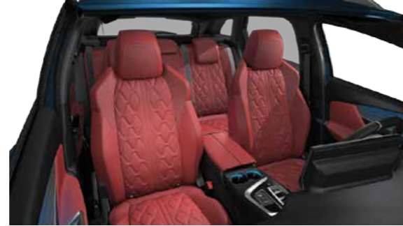
Red Nappa Leather جلد نابا أحمر