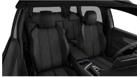
Black Nappa Leather جلد نابا أسود

Sit back and relax in the 3008 PHEV with high-end leather or Alcantara options.