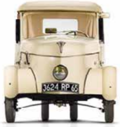
The PEUGEOT VLV Microcar Powered by four 12V batteries with a speed of 22 mph.

بيجو VLV مايكرو تجمع أربع بطاريات بقوة 12V، وتتمتع بسرعة 35 كم/ساعة.