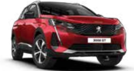
Ultimate Red أحمر التيمت