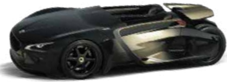
The PEUGEOT EX1 For peak electric performance, the electric EX1 concept car was launched & broke 6 world records - by the International Automobile Federation.

بيجو EX1 تم إطلاق سيارة EX1 الكهربائية المبتكرة لأقصى أداء كهربائي، وقد حققت 6 أرقام قياسية في العالم برعاية الاتحاد الدولي للسيارات.