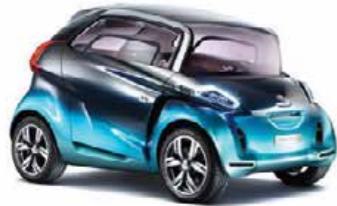
The PEUGEOT BB1 The bold and 100% electric city car concept, perfect for daily urban use.

بيجو BB1 سيارة مبتكرة جريئة وكهربائية 100%، مصممة للاستعمال اليومي داخل المدينة.