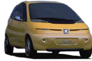
The PEUGEOT ION CONCEPT The first draft of an urban electric vehicle, designed for the city with a 20 kW electric motor.

بيجو أيون المبتكرة التصميم الأول لسيارة كهربائية حضرية، صممت خصيصاً للمدينة وتتمتع بمحرك كهربائي بقوة 20 كيلوواط.