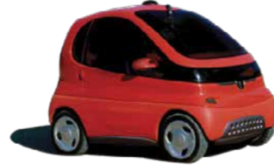
The PEUGEOT TULIP A concept vehicle for Individual & Public Urban Transport within the city.

بيجو تولب مركبة مبتكرة للتنقل الفردي والعام داخل المدينة.