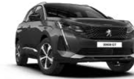
Platinum Grey رمادي بالاتينوم