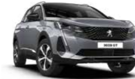
Cumulus Grey رمادي كومولس