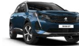
Celebes Blue أزرق سيليبس

Choose from a palette of seven premium colours.